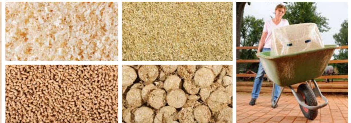
Vier Produkte für die Box: Im Test waren (im Uhrzeigersinn) Späne, Leinstroh, Pellets und Taler. Rechts: Zu kämpfen hatte Martina Müller-Stahl mit den schweren Allspan-Bällen.