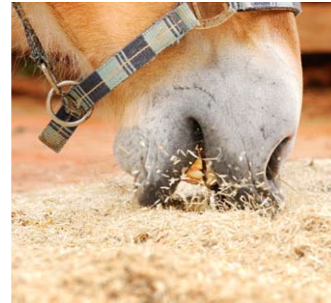
Schmeckt es oder schmeckt es nicht? Tuuli prüft das Leinstroh.

Mistgabel, sondern nur mühsam mit den Händen“, erzählt Martina Müller-Stahl. Zudem war ihr die Ballengröße von 650 Litern zu üppig dimensioniert. „Arbeitet man alleine als Frau im Stall, hat man Probleme, die Ballen auf die Schubkarre zu wuchten.“ Allspan bietet die Späne jedoch auch in kleineren Ballen von 550 bis 600 Litern an. Besonders handlich waren die Reformtaler und die Pellets verpackt. Durch das Gewicht von 20 Kilogramm konnte Müller-Stahl auch den größeren Ecoflax-Ballen einfach transportieren.